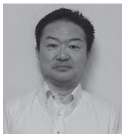
パナソニックエイジフリー株式会社 専務執行役員 ライフサポート事業部長

当社は訪問介護・居宅介護支援を主軸とする在宅介護事業を、一都三県で展開しています。現下の新型コロナウイルスの影響で、介護業界の先行きが不透明な状況において、個社の経営努力だけではなく、協会の担うべき役割は大きくなっていると感じております。業界発展に貢献すべく努めて参りますので、何卒宜しくお願い致します。