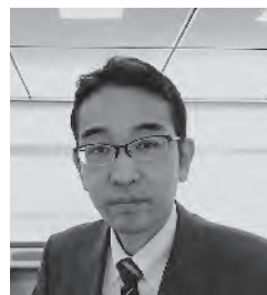
東京海上日動ベターライフ サービス株式会社 執行役員 在宅介護事業部長