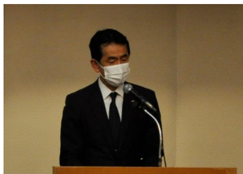
森会長による挨拶